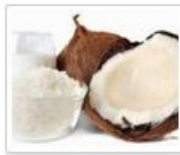
Kókusztej helyleg kókuszreszelékből