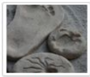
Készíts követ homokgyurmából!