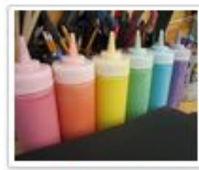
Puffi festék recept