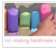
Saját készítésű krete - asztalterítő projekt